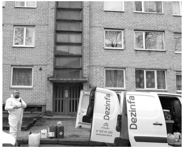
UAB „Dezinfa“ komanda dezinfekavo dviejų Anykščių daugiabučių, kuriuose gyvena sergantys koronavirusu, laiptines.