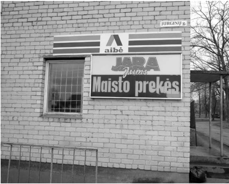
Janušavos „Jara Jums“ parduotuvė dviem savaitėms užvėrė duris.