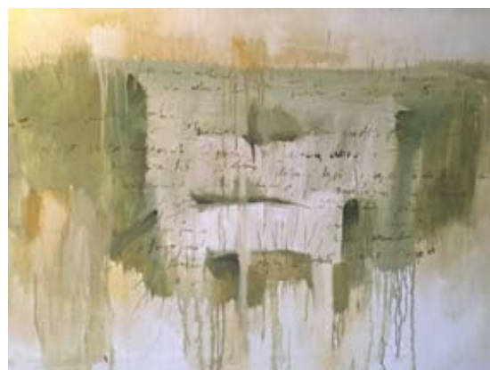
Kūrinys iš ciklo „Laiškai tau“.