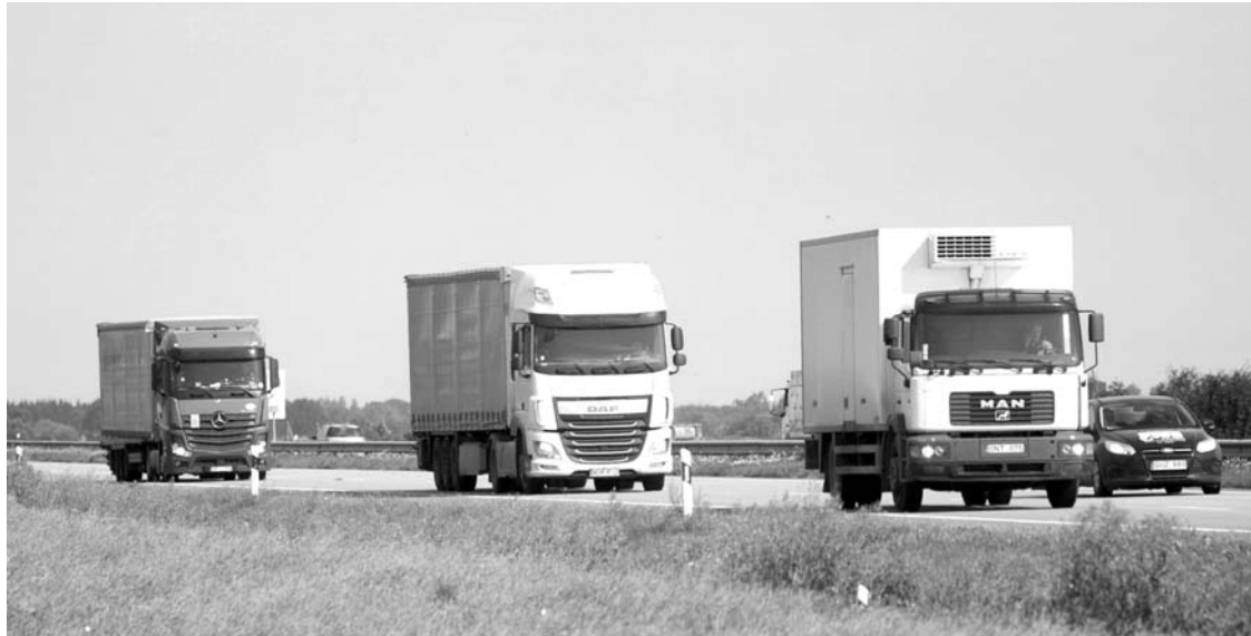
Sunkvežimių vairuotojai - vienintelė grupė žmonių, kurių izoliacijos po grįžimo iš užsienio valstybė nefinansuoja.

Anykštėnai - tolimųjų reisų sunkvežimių vairuotojai, kuriems grįžus į Lietuvą karantinavimui nesuteikiamos savivaldybės patalpos, atskleidė kuriozinę situaciją. Savivaldybės įpareigos nemo kamai suteikti patalpas saviizoliacijai iš užsienio šalių deportuotiems lietuviams ar iš prabangių atostogų grįžusiems asmenims. O tolimųjų reisų vairuotojų karantinas yra jų darbdavių arba pačių vairuotojų reikalas.